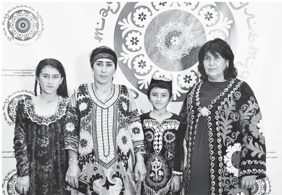
Дар акс: оила ба хушбахтӣ ва пирӯзӣ дар самти тарбияи фарзандон бо роҳи меҳнат муваффақ мегардад.