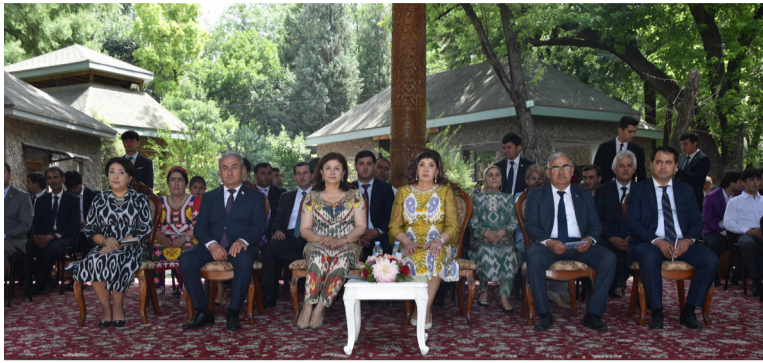
(Аввалаш дар саҳ. 4)

ҳар як минтақаи ҷумҳурӣ, афзун намудани истеҳсол ва муаррифии ҳунарҳои мардумӣ маҳсуб мешавад. Масъалаи муҳимми рӯз, ин беҳтар намудани раванди таълиму тарбия ва дар сатҳи баланди касбӣ тайёр намудани касбомӯзон мебошад.